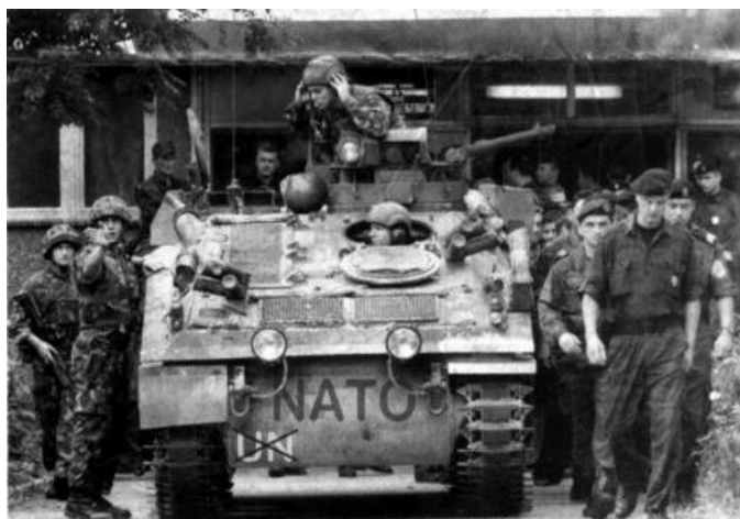
Selbstmandatierung, „Friedens erzwingen“ – Die NATO als neues Synonym für „internationale Gemeinschaft“

Die geographische Bestimmung des Zuständigkeitsbereiches ist dabei so vage - „in und um den euro-atlantischen