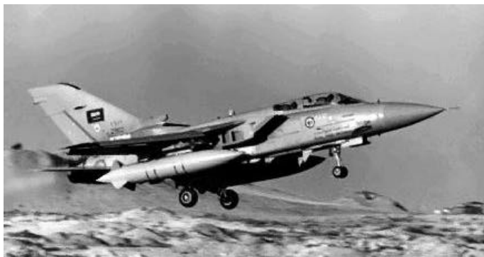
Kampflugzeug „Tornado“ – In Jugoslawien mit dabei

„Die Bundeswehr hat die Aufgabe der Landes- und Bündnisverteidigung und kann darüber hinaus nur im Rahmen eines UNO- und OSZE-Mandats für Friedensmissionen ... eingesetzt werden. Die NATO ist und bleibt ein Verteidigungsbündnis. Das globale Gewaltmonopol zur Sicherung des Weltfriedens liegt ausschließlich bei den Vereinten Nationen.“ (Bundestagswahlprogramm der SPD 1998)