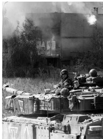
KFOR vor brennendem serbischem Haus in Pristina