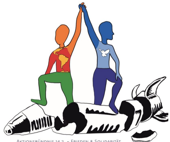
AKTIONSBÜNDNIS 14.2. – FRIEDEN & SOLIDARITÄT

Wir verlangen von der deutschen Regierung, den USA die Gefolgschaft zu verweigern und sich für Frieden, Dialog und Völkerrecht einzusetzen. Wir verlangen, dass sie jegliche Gewaltandrohung gegen Venezuela, Kuba, Kolumbien, Nicaragua, Panama und Mexiko und auch Kanada sowie Grönland verurteilt und auf den Abzug der Armada aus der Karibik besteht. Ebenso fordern wir Abrüstung hier, statt destabilisierender Hochrüstung. Denn darin besteht Deutschlands internationale Verantwortung, wie sie sich aus der UN-Charta, dem Grundgesetz und 2+4-Vertrag als Konsequenz vor allem des 2. Weltkriegs ableitet.